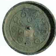
大藪経塚出土銅鏡

【時 間】各日1回目午後1:30～ 2回目午後3:00～ 【場 所】かつらぎ総合文化会館 4階 会議室C 【対 象】小学3年生以上 【募集人数】各回4組(1組2人まで) 【材料費】700円