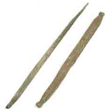
丁ノ町・妙寺遺跡出土土製品 (紡織機の可能性)

【時 間】1回目午後1:00～ 2回目午後3:00～ 【場 所】かつらぎ総合文化会館 3階 研修室 【募集人数】各回4人 【材料費】500円